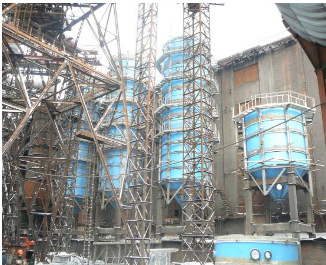
Фото №6. Монтаж скрубберов из стеклопластика в агломерационном цехе ГОП ОАО «ММК»

Изготовление монтажных заготовок из стеклопластика для устройства корпуса скруббера и газоходов чистого газа к выхлопным трубам, последующая сборка его на монтажной площадке осуществлялась фирмой «АЗОС».(см.фото № 6, № 7).