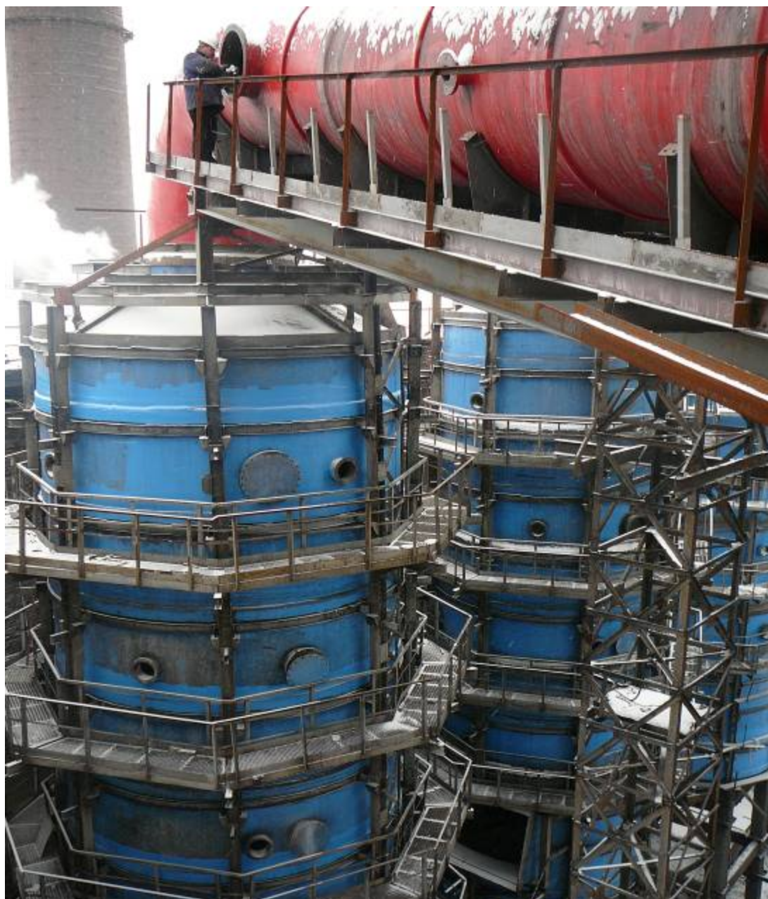
Фото №7. Монтаж подводящего газохода из стеклопластика к скрубберам. в агломерационном цехе ОАО «ММК»

Благодаря такой конструкции удалось уменьшить толщину стенки скруббера из стеклопластика с 35 мм до 20 мм и соответственно снизить стоимость почти на 30%.