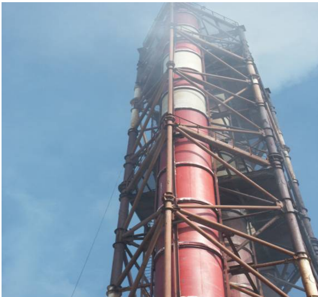
Фото № 1. Трёхствольная труба из фаолита в смонтированном виде.

При этом решается конструкция узлов независимой подвески отдельных царг к несущему каркасу, обеспечивая наиболее благоприятные по нагрузкам условия работы элементов газотводящего ствола ( как правило, соединение раструбное), обеспечивающее одновременно герметичность этого соединения и возможность осевых вертикальных перемещений (раструбы заполняются специальными химстойкими герметиками), возникающих за счет большой разницы коэффициентов линейного расширения стали и полимерного материала. Фото № 1, 2 ( трехствольная труба из фаолита для АЦБК).