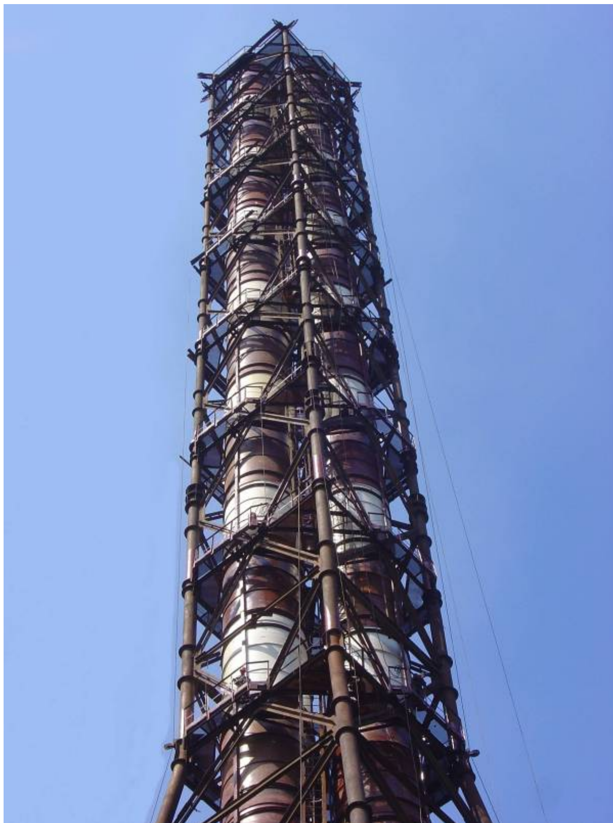
Фото № 4. Двухствольная труба из стеклопластика агломерационного цеха ОАО «ММК»