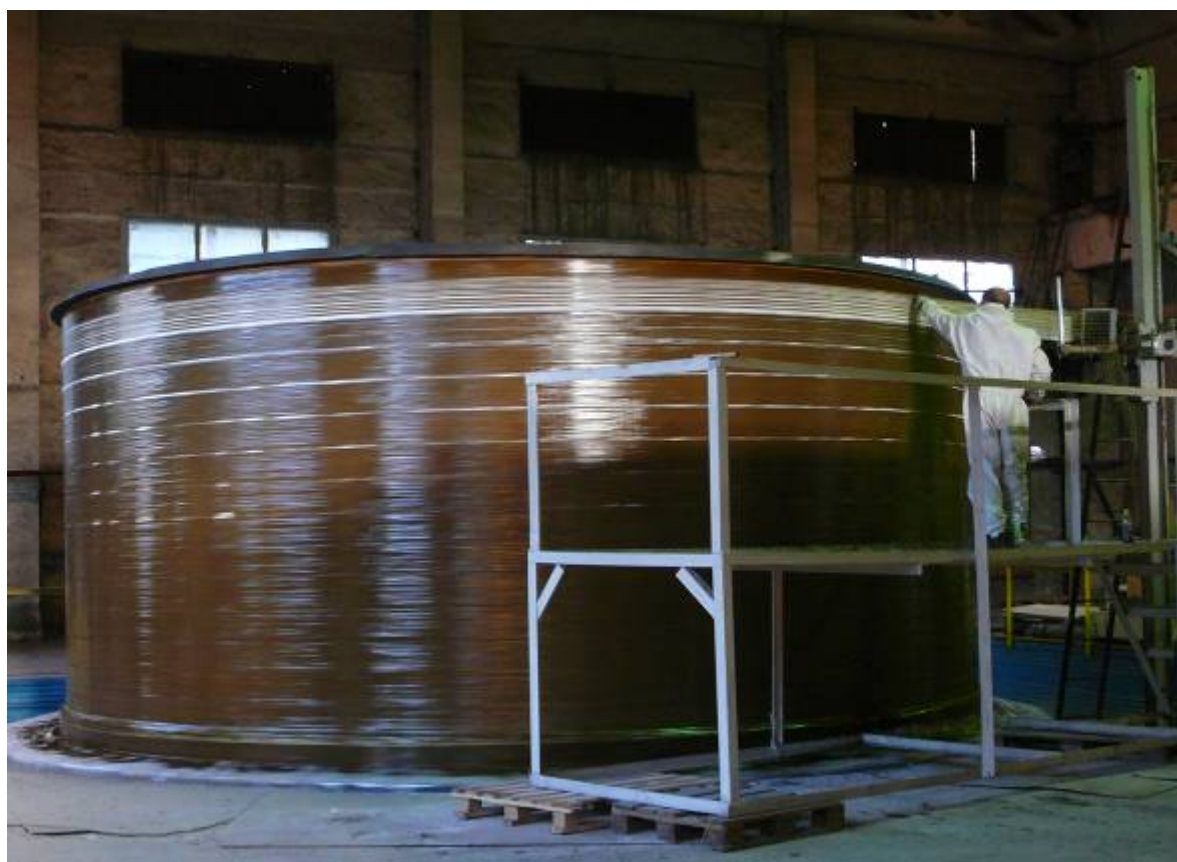
Фото № 5. Процесс намотки корпуса крупногабаритного оборудования на монтажной площадке.

При конструировании нестандартного оборудования из стеклопластиков мы ориентируемся на технологию, освоенную фирмой «АЗОС» и имеющееся у этой фирмы оборудование как по намотке цилиндрических обечаек, так и по контактному формованию. С учетом имеющихся у этого изготовителя оборудования удалось максимально механизировать и автоматизировать процесс намотки. Причем у фирмы «АЗОС» есть стационарное оборудование по намотке, эксплуатирующееся на промышленной базе в г. Первоуральске, на котором мотаются изделия \varnothing до 3 м, т.е. транспортабельные и есть переносные мобильные установки, позволяющие на месте монтажа изготавливать обечайки \varnothing до 8,0 м. (фото № 5)