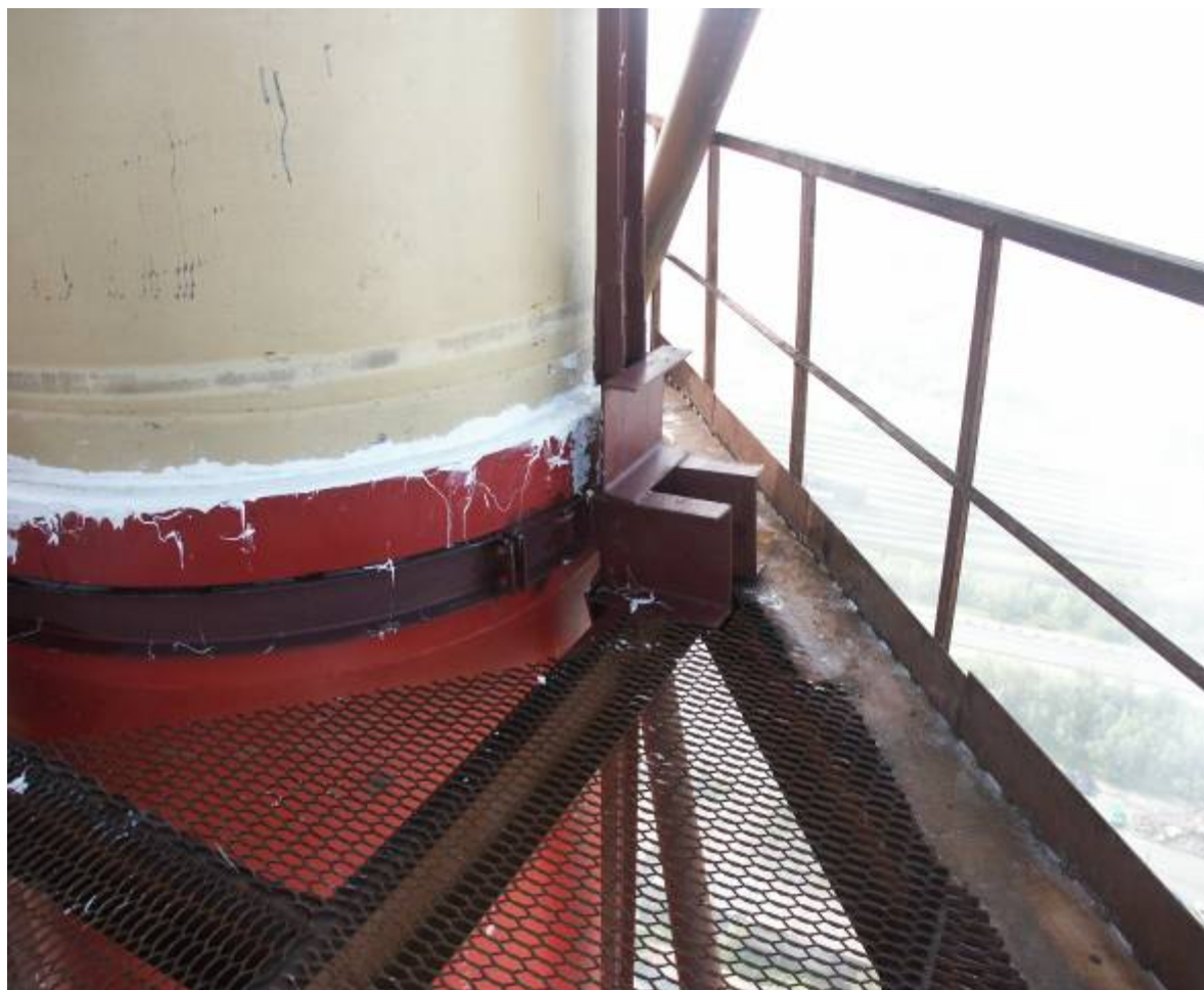
Фото № 2. Заделка раструбов химстойким герметиком.

В настоящее время в промышленности эксплуатируется свыше 300 вытяжных башен с газоотводящими стволами из различных полимерных материалов. Они смонтированы на объектах по производству минеральных удобрений, химических волокон, угольной промышленности (сушильных агрегатах углеобогажительных фабрик), горно-обогажительных комбинатов, грануляционных установок и травильных цехов металлургических заводов, алюминиевых заводов и других объектов на территории бывшего СССР от Прибалтики до Тихого океана. Габариты труб – диаметры от 0,8 до 7,0 м, высоты до 200 м. Так, на фото №3 показано изготовление царг Ø2,8 м из стеклопластика для двухствольной трубы Н=100 м агломерационного цеха ОАО «ММК» (фото №4) Изготовление производится с помощью намоточного станка на промбазе в г. Первоуральск фирмы «АЗОС».