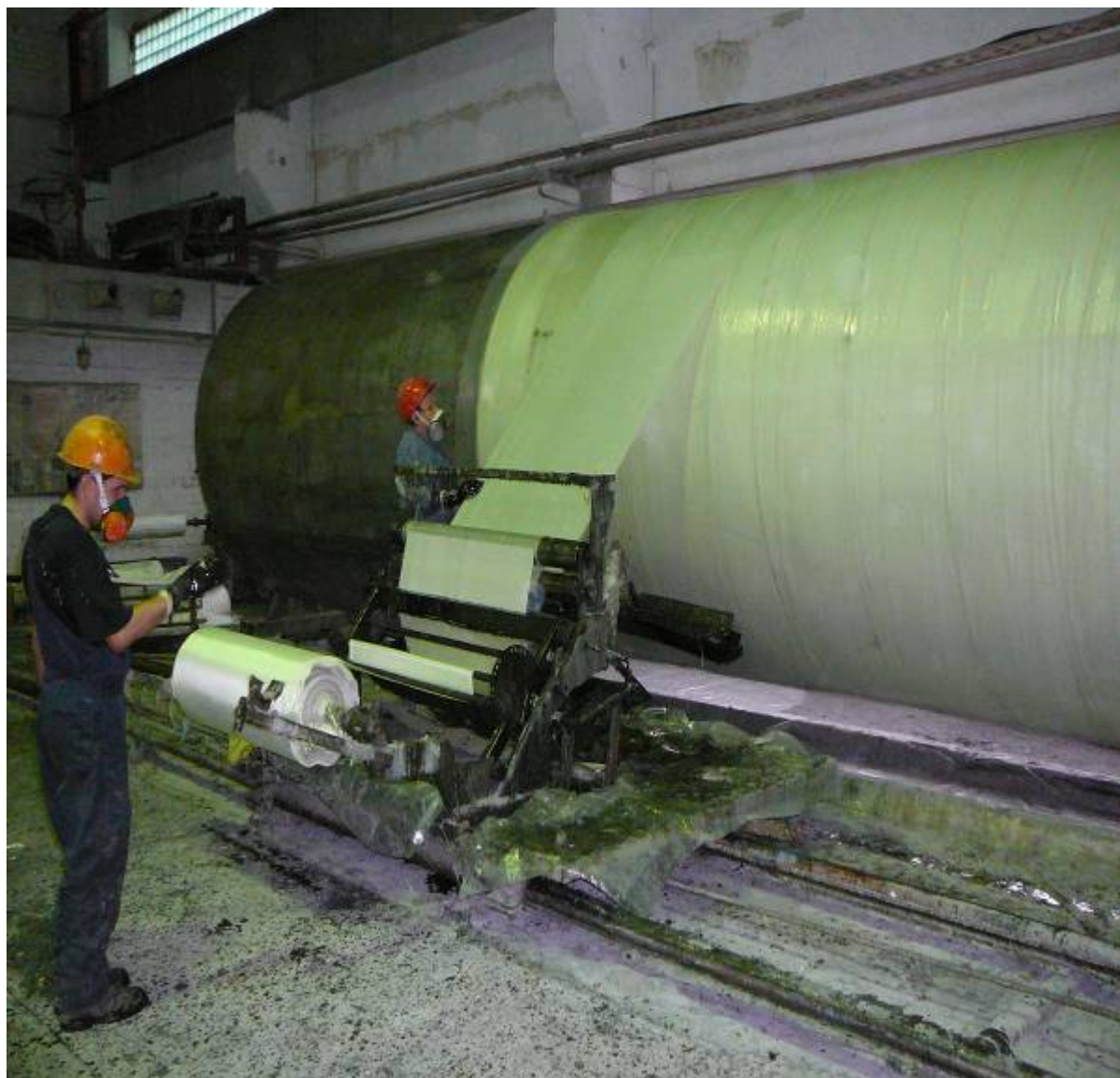
Фото № 3. Изготовление царг из стеклопластика.